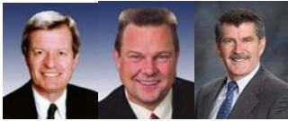
Sen. Max Baucus (D) Sen. Jon Tester (D) Rep. Denny Rehberg (R) At-Large