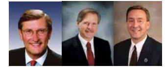
Sen. Kent Conrad (D) Sen. John Hoeven (R) Rep. Rick Berg (R) At Large