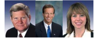
Sen. Tim Johnson (D) Sen. John Thune (R) Rep. Stephanie Herseth-Sandlin (D) At Large