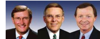
Sen. Kent Conrad (D) Sen. Byron Dorgan (D) Rep. Earl Pomeroy (D) At Large