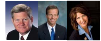
Sen. Tim Johnson (D) Sen. John Thune (R) Rep. Kristi Noem (R) At Large