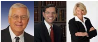
Sen. Mike Enzi (R) Sen. John Barrasso (R) Rep. Cynthia Lummis (R) At Large