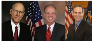
Sen. Pat Roberts (R) Sen. Jerry Moran (R) Rep. Tim Huelskamp (R) CD 1