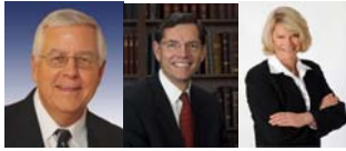
Sen. Mike Enzi (R) Sen. John Barrasso (R) Rep. Cynthia Lummis (R) At Large