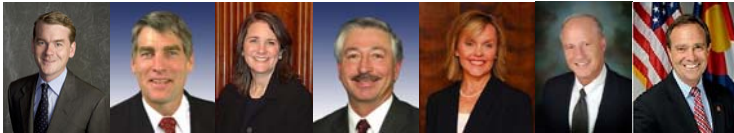
Sen. Michael Bennet (D) Sen. Mark Udall (D) Rep. Diana DeGette (D) CD 1 Rep. John Salazar (D) CD 3 Rep. Betsy Markey (D) CD 4 Rep. Mike Coffman (R) CD 6 Rep. Ed Perlmutter (D) CD 7