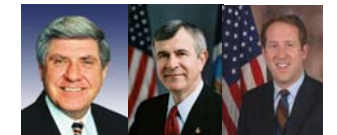
Sen. Ben Nelson (D) Sen. Mike Johanns (R) Rep. Adrian Smith (R) CD 3