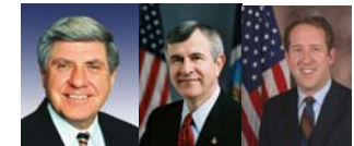
Sen. Ben Nelson (D) Sen. Mike Johanns (R) Rep. Adrian Smith (R) CD 3