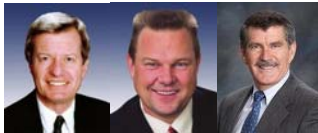
Sen. Max Baucus (D) Sen. Jon Testor (D) Rep. Denny Rehberg (R) At-Large