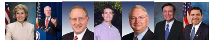
Sen. Kay Bailey-Hutchison (R) Sen. John Cornyn (R) Rep. Mike Conaway (R) CD 11 Rep. Mac Thornberry (R) CD 13 Rep. Randy Neugebauer (R) CD 19 Rep. Quico Canseco (R) CD 23 Rep. Henry Cuellar (D) CD 28