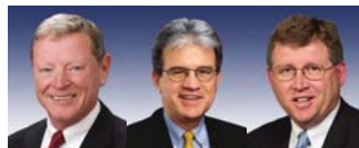
Sen. James Inhofe (R) Sen. Tom Coburn (R) Rep. Frank Lucas (R) CD 3