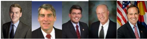
Sen. Michael Bennet (D) Sen. Mark Udall (D) Rep. Cory Gardner (R) CD 4 Rep. Mike Coffman (R) CD 6 Rep. Ed Perlmutter (D) CD 7