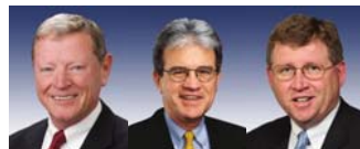
Sen. James Inhofe (R) Sen. Tom Coburn (R) Rep. Frank Lucas (R) CD 3